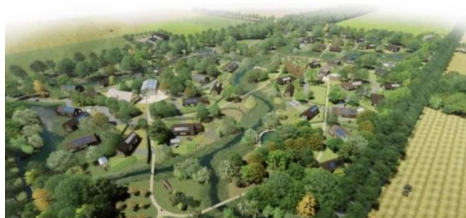
Figuur 2; Natuur inclusieve woningbouw door Sustainer Homes