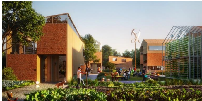
Figuur 4; Gebiedsontwikkeling Brainport Smart District, ambitieus initiatief in Helmond om oplossingen te zoeken voor grote en complexe maatschappelijke opgaven.

Enkele architectenbureau's (Sustainer Homes en ORGA) en projectontwikkelaars (Projects in Green en KRKTR) hebben reeds aangegeven dat zij beschikbaar zijn om gemeentelijke streefprogramma's op basis van de nieuwste inzichten in de woningbouw te kunnen vormgeven, waarbij gebouwd wordt met biobased materialen. De Helmondse, als burgerinitiatief tot stand gekomen stichting, Brainport Smart District, wil graag kennis delen, waarmee zij met de nieuwste technieken en inzichten de slimste wijk ter wereld ontwikkelen. Hun kennis en ervaring kan gebruikt worden om de voor dit gebied meest passende elementen in de woonwijk terecht te laten komen.